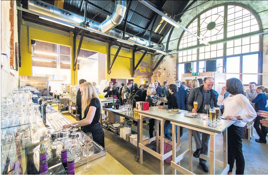
Het in De Loods gevestigde cafe-restaurant bedient nu het publiek van het tijdelijke Ebblingelab en in de toekomst de nieuwe bewoners van de creatieve stadswijk Ebblingkwartier in Groningen.