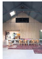
De geheel verbouwde schuur van Wongema.