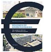
Titel. Rekenen op herbestemming. Auteurs: Sander Gelinck en Frank Strolenberg. Uitgeverij: Nai 010. Prijs 34,50 (296 blz.)

Zelfstandige businesspaviljoens geven het terrein extra gewicht, waaronder een van de RUG. De initiatiefnemers wonen in de buurt. Zij hadden er geen zin in om jarenlang tegen stenen en schuttingen aan te kijken. Een typisch geval van werken van onderop dus. Na 2016 zullen de onderdelen langzaam worden 'opgegeten' door nieuwbouw, maar wie weet wat er in de vitale stad dan elders weer op gang is gebracht.