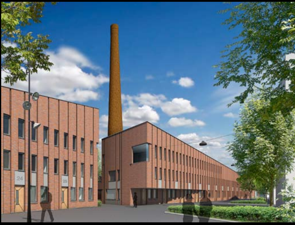
De Laatste Pijp aan het Boterdiep als trait d'union tussen oud en nieuw Groningen: het oude Ebbingekwartier en de nieuwbouw van Clboğa naar ontwerp van bureau De Zwarte Hond.